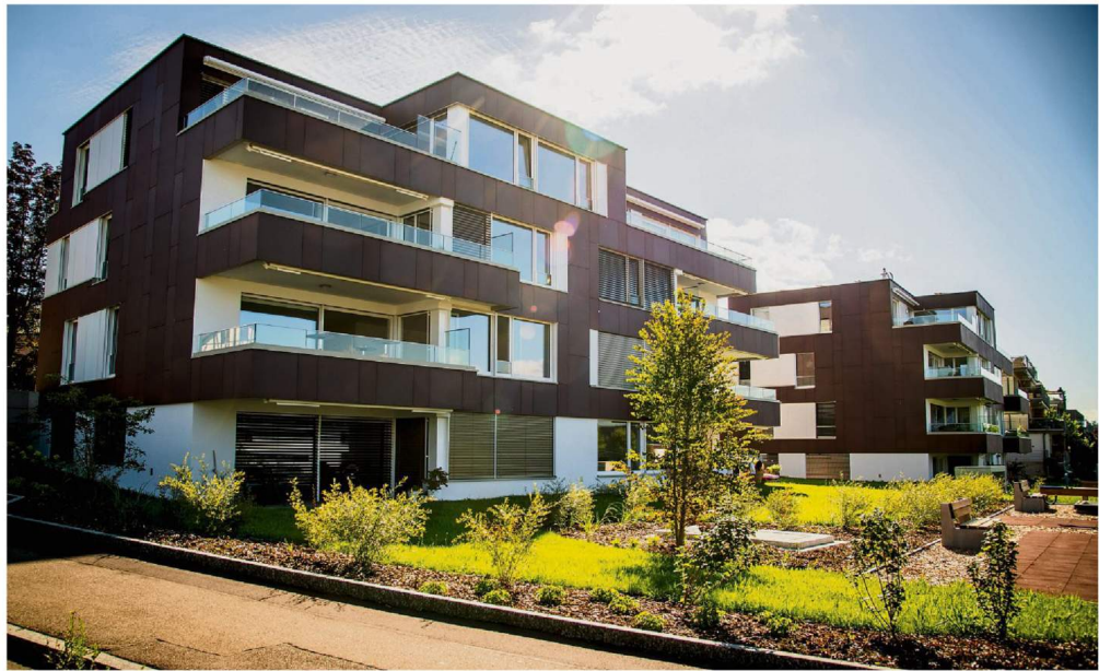
Cleveres Energiemanagement: Die Fassaden und Dächer der Häuser in Männedorf ZH bestehen aus weissen und braunen Photovoltaikmodulen.

Dieses Vorgehen ist jedoch noch Zukunftsmusik. Die Methanherstellung ist heute noch zu gering und um ein Vielfaches teurer als Erdgas. So wird heute der überschüssige Solarstrom für die elektrochemische Herstellung von Methan verwendet werden. Das Gas wird dann ins Erdgasnetz gespeist. Die