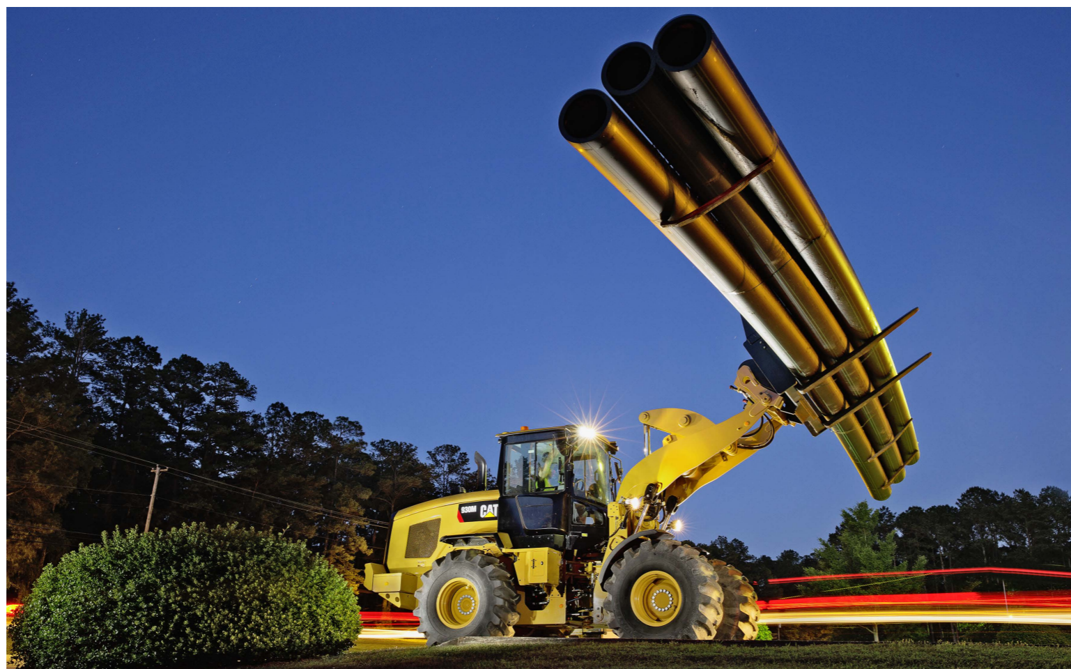
Leistungsstark, effizient, vielseitig und komfortabel sind die Radlader der M-Serie. Ein grosses Augenmerk wurde auch auf die Treibstoffeffizienz gelegt. Hier ein 930M.

Der stufenlose, elektronisch gesteuerte, intelligente hydrostatische Fahrtrieb mit vier Bereichen wurde weiter verbessert und weist vom Fahrer wählbare Antriebsstrang-