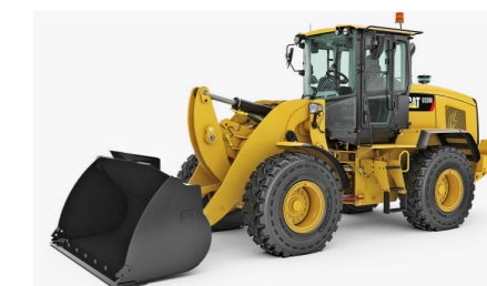
Die Fahrerkabine bei den Radladern (hier ein 938M) wurde noch mehr optimiert. Resultat: Komfort und Sicherheit den ganzen Tag.

Die mittelgrossen Radlader der Baureihe M erweisen sich durch das Cat-Wägesystem jetzt als noch effizienter. Die zu Cat Connect gehörende Funktion zur Ermittlung der Nutzlast (Cat Connect Payload) erhöht die Produktivität beim Laden und Transportieren bei Einsätzen, bei denen die Kunden präzise Gewichtsermittlung und exakte Lasten verlangen. Dieses System ermittelt das Gewicht beim Füllen der Schaufel – ohne Unterbrechung des Ladetakts. Durch fortschrittliche Wiegefunktionen kann der Fahrer die Last vor dem Verlassen der Halde rasch anpassen. Die Nutzlastdaten lassen sich auf einen Blick ablesen. Darüber hinaus werden die Nutzlastdaten gespeichert, sodass die Manager die Produktion beobachten können. Durch das Cat-Wägesystem profitieren die Kunden von kürzeren Arbeitstaktzeiten, höherer Produktivität sowie geringeren Kraftstoff- und Betriebskosten. pd