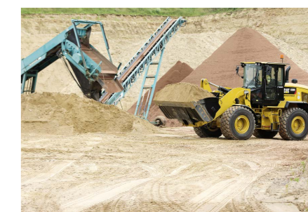
Der stufenlose hydrostatische Fahrtrieb wurde auch beim 938M weiter verbessert.

leistungsausführung und Arbeitsgeräte aus, die die Vielseitigkeit der Maschine insgesamt steigern. Mit einer Nettoleistung von 171 kW (232 HP metrisch) bietet der neue 950M eine um 9 Prozent höhere Leistung als sein Vorgänger der Baureihe K, während der 962M mit einer Nettoleistung von 186 kW (253 HP metrisch) 13 Prozent mehr Leistung bietet.