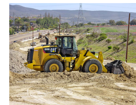
Auch die Radlader 950M (links) und 962M (Mitte und rechts) haben einen Cat-Motor, der die Emissionsnormen Stufe IV einhält, und sie bieten mehr Leistung als ihre Vorgänger. Dank dem Cat-Wägesystem können die Fahrer dieser sehr vielfältigen Maschinen zudem zuverlässig genaue Lasten erzielen.