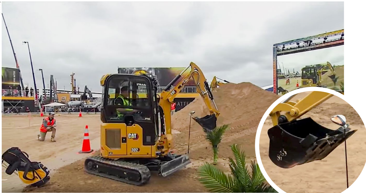
Millimetergenau wird die Minibaggerschaufel beim Aufnehmen des Golfschlägers angesetzt, um dann in einigen Metern Entfernung wieder eingesteckt zu werden. Danach war noch ein Golfball einzulochen.