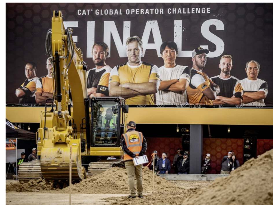
Nur neun Baumaschinen-Profis hatten sich weltweit für die Weltmeisterschaft in Las Vegas qualifiziert.

Maschinenführer arbeiten bei Wind und Wetter, oft von Morgengrauen bis Sonnenuntergang – man sollte meinen, alles