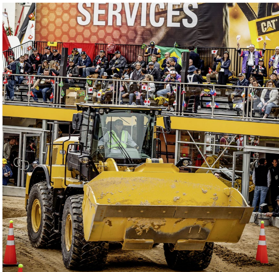
Eng ging es in der Arena zu. Die schweren Baumaschinen fuhren bei ihren Aufgaben direkt an den Zuschauerrängen vorbei.

Casinos eine eindrückliche Kulisse – Wettkampfbedingungen die für einen Europäer alles andere als normal sind und letztendlich doch etwas Nervosität aufkommen liessen.